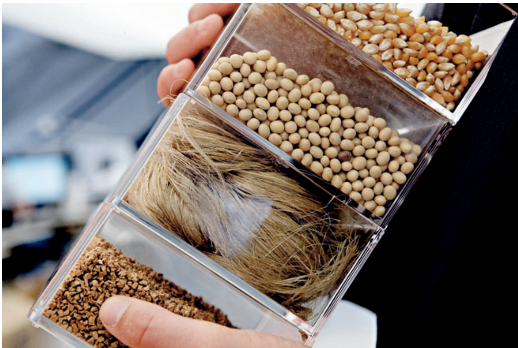
Hør, kork, majs og soja er ingredienserne i 3XN's egenudviklede biokomposit.