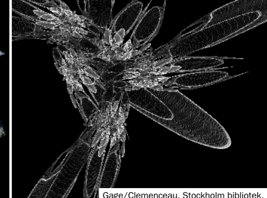
Gage/Clemenceau, Stockholm bibliotek.