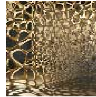
Adrew Kudless, Wall.