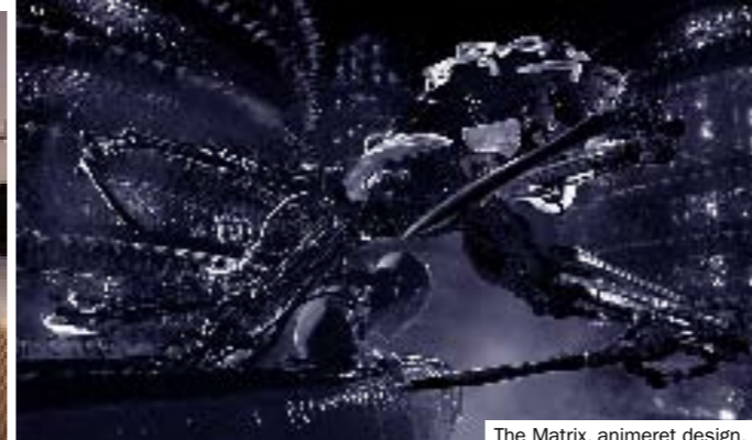
The Matrix, animeret design.