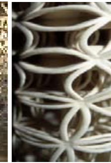
Ali Rahim, 3D-printet model.