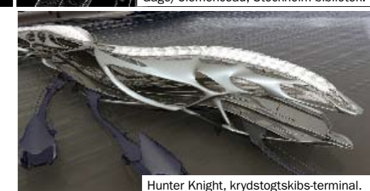
Hunter Knight, krydstogtskibs-terminal.